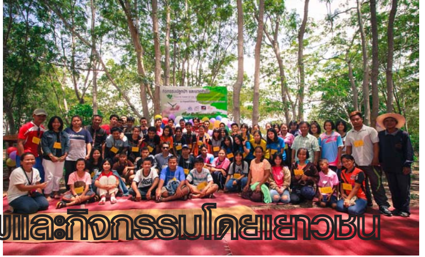
“แชมป์ชาย” บัตรภาพและกิจกรรมโดยเยาวชน