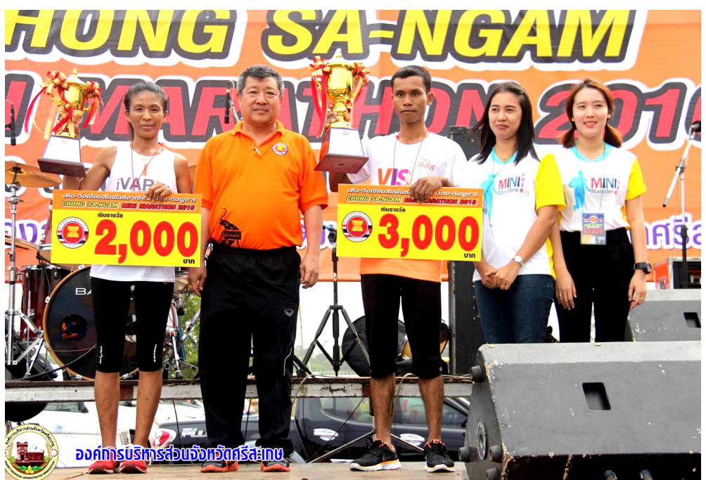
องค์การบริหารส่วนจังหวัดศรีสะเกษ