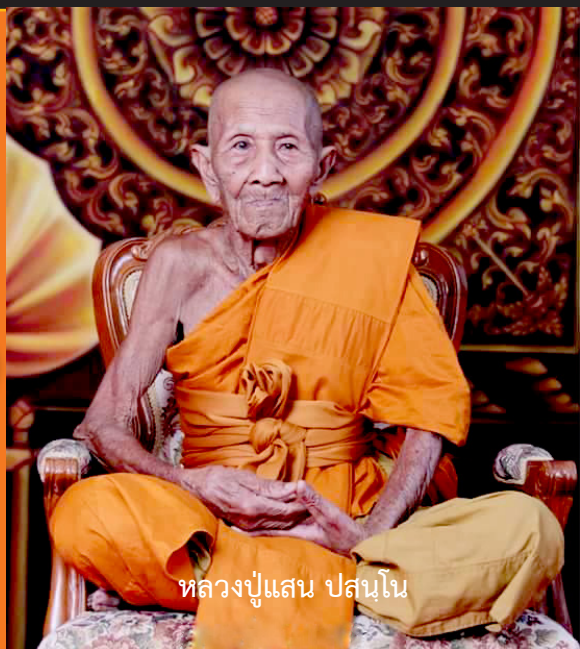
หลวงปู่แสน ปสนโน