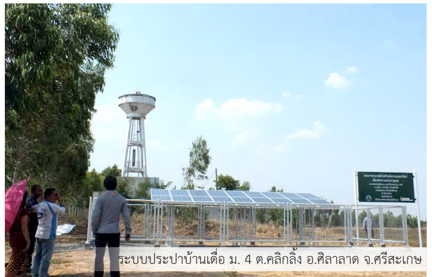
ระบบประปาบ้านเตือ ม. 4 ต.คึกคัก อ.ศีลาลาด จ.ศรีสะเกษ