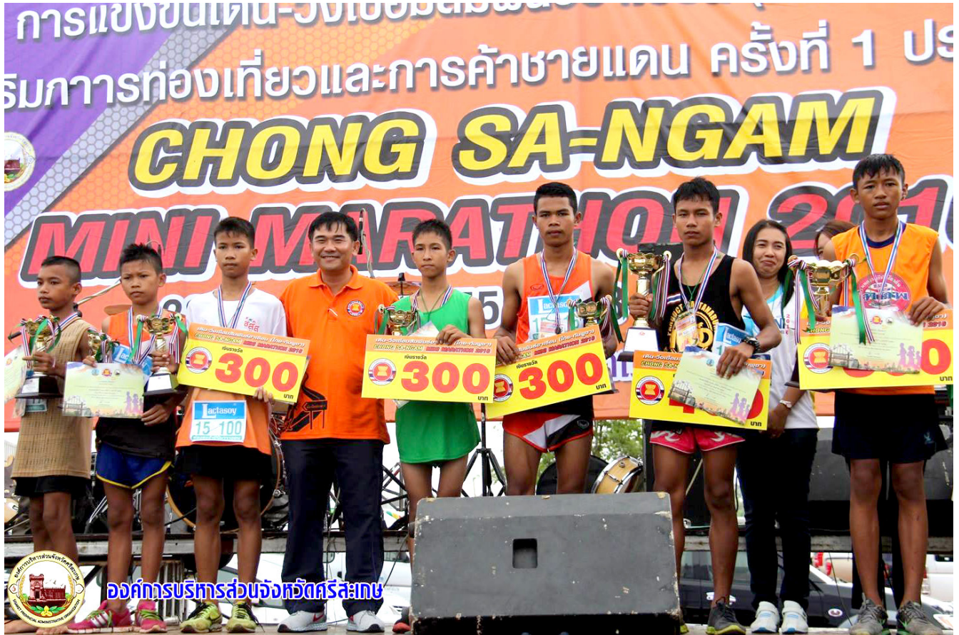
องค์การบริหารส่วนจังหวัดศรีสะเกษ