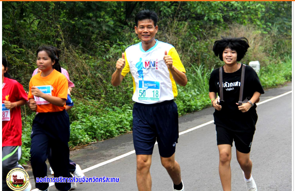
องค์การบริหารส่วนจังหวัดศรีสะเกษ

นายวิเชียรเปิดเผยว่า การจัดกิจกรรมดังกล่าว เพื่อเชื่อมความสัมพันธ์ระหว่างประเทศอาเซียนให้แน่นแฟ้นยิ่งขึ้น ทั้งยังเป็นการส่งเสริมเรื่องการท่องเที่ยว การค้า การลงทุนระหว่างชายแดน ที่สำคัญก็คือ เพื่อเฉลิมพระเกียรติพระบาทสมเด็จพระเจ้าอยู่หัว ภูมิพลอดุลยเดชมหาราช เนื่องในโอกาสเฉลิมฉลองวโรกาสสมบัตินครบ 70 ปี 9 มิถุนายน 2559 และสมเด็จพระนางเจ้าฯ พระบรมราชินีนาถ ทรงเจริญพระชนมพรรษา 7 รอบ 84 พรรษา 12 สิงหาคม 2559 นอกจากนี้ผู้เข้าร่วมการแข่งขันยังได้ออกกำลังกายเพื่อสุขภาพที่ดีอีกด้วย