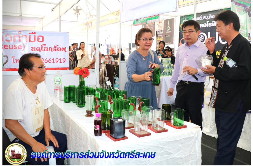
องค์การบริหารส่วนจังหวัดศรีสะเกษ

โดยองค์การบริหารส่วนจังหวัดศรีสะเกษ ได้เตรียมการพัฒนา และบริหารจัดการเมืองใหม่ช่องสะเกษมาตั้งแต่ปี 2552 และเมื่อวันที่ 23 พฤษภาคม 2557 ได้รับอนุญาตและรับมอบพื้นที่เมืองใหม่ช่องสะเกษ จากกรมป่าไม้ เพื่อพัฒนาและบริหารจัดการเมืองใหม่ช่องสะเกษ และตลาด โรงเกลือศรีสะเกษ ให้เป็นศูนย์กลางการค้าการลงทุน การท่องเที่ยวภายใน จังหวัดศรีสะเกษ ระหว่างประเทศเพื่อนบ้านและประเทศในภูมิภาค เพื่อให้ประชาชนตามแนวชายแดนไทย-กัมพูชามีรายได้และมีอาชีพ สามารถ แก้ไขปัญหาความยากจนได้อย่างยั่งยืน อันส่งผลให้เกิดการเจริญเติบโต ทางเศรษฐกิจในระดับมหภาคของประเทศ