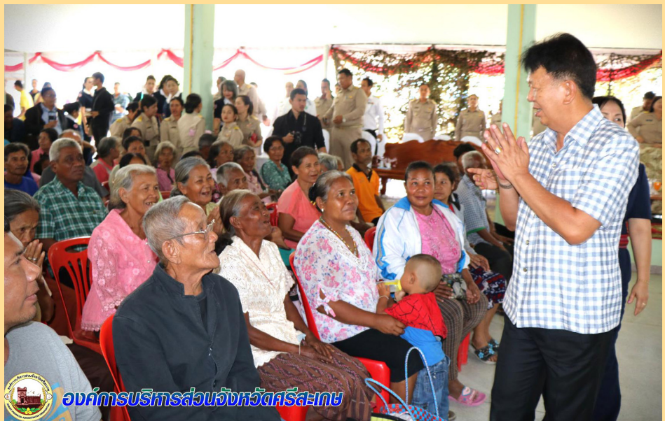
อบจ.ศรีสะเกษ