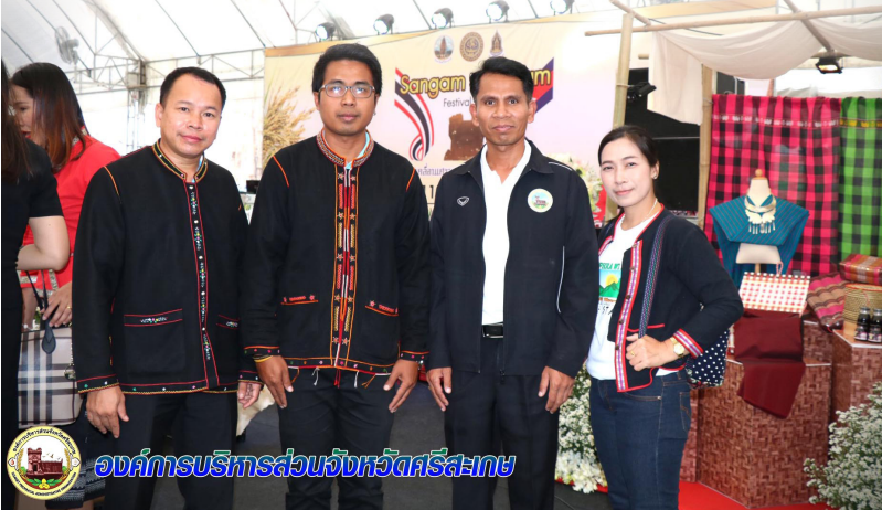
องค์การบริหารส่วนจังหวัดศรีสะเกษ

นอกจากนี้ องค์การบริหารส่วนจังหวัดศรีสะเกษยังเป็นหน่วยงานหลักที่รับผิดชอบบริหารจัดการพื้นที่เมืองใหม่ช่องสะเกษ ทั้งนี้ได้จัดสรรงบประมาณเต็มที่ในการพัฒนาเมืองใหม่ช่องสะเกษอย่างต่อเนื่อง โดยมีบทบาทหน้าที่เป็นผู้ดำเนินการและสนับสนุนข้อมูลด้านต่างๆ และการจัดการประชุมความร่วมมือประสานงานบูรณาการกับหน่วยงานที่เกี่ยวข้องอย่างใกล้ชิดอีกด้วย