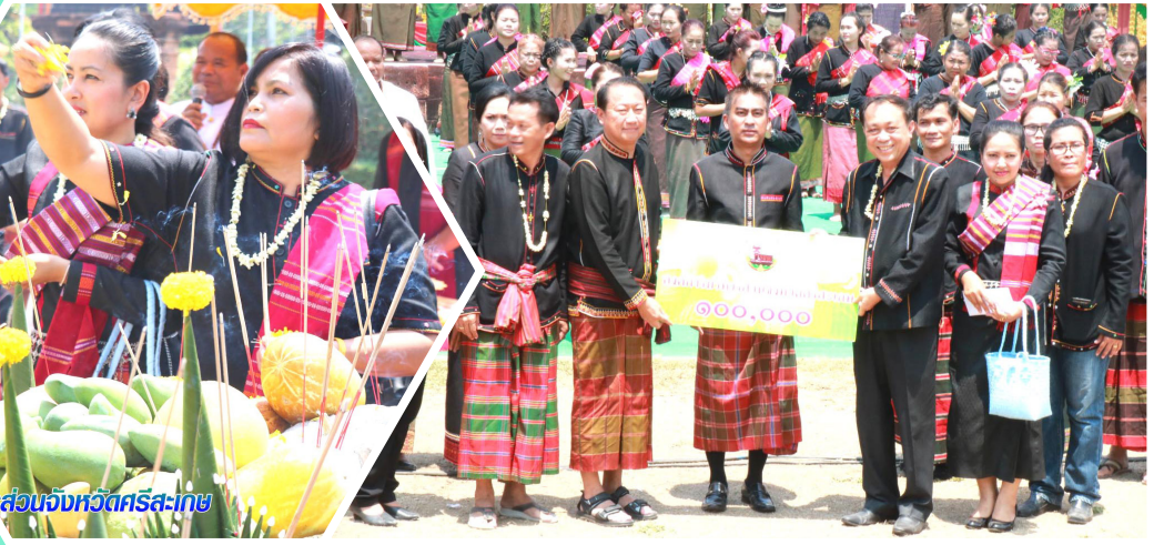
อบจ.ศรีสะเกษ