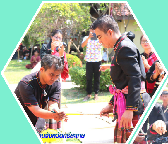
อบจ.ศรีสะเกษ