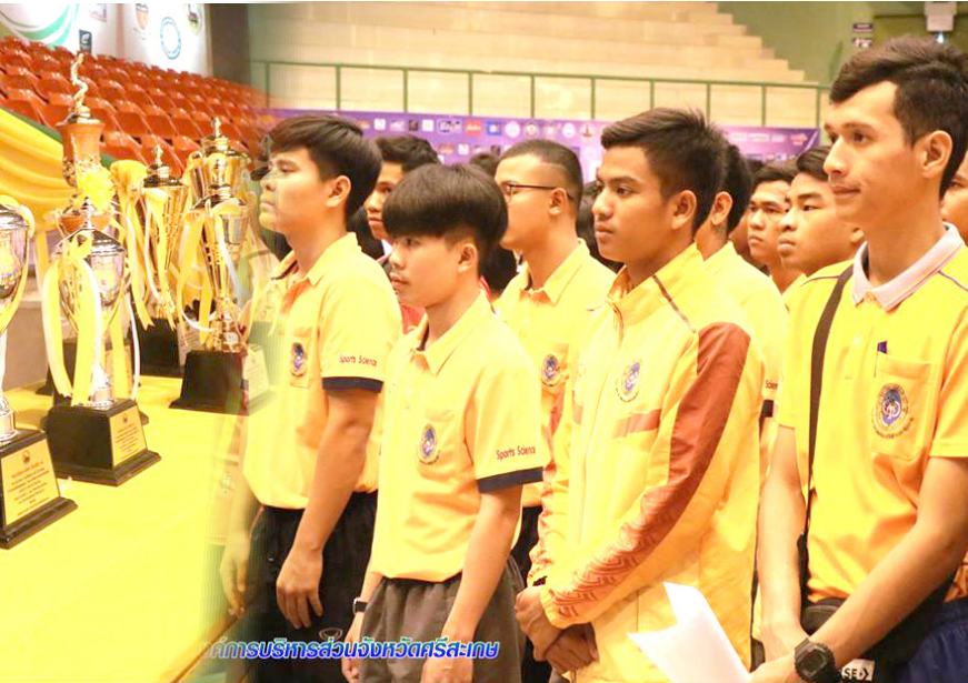
ภาพการบริการส่วนจังหวัดศรีสะเกษ