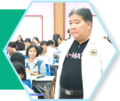
ศรีสะเกษ