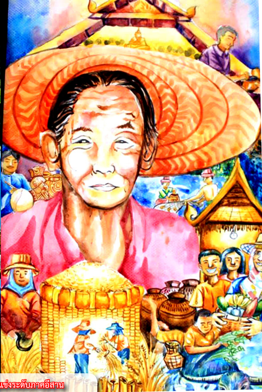
ภาพขณะเลิศ การประกวดแข่งระดับภาคอีสาน โดย...นักเรียนโรงเรียนกุศลเสลาวิทยาควม สังกัด อบจ.ศรีสะเกษ