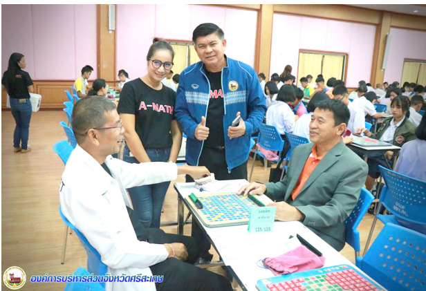
องค์การบริหารส่วนจังหวัดศรีสะเกษ