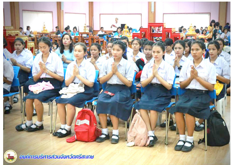
องค์การบริหารส่วนจังหวัดศรีสะเกษ