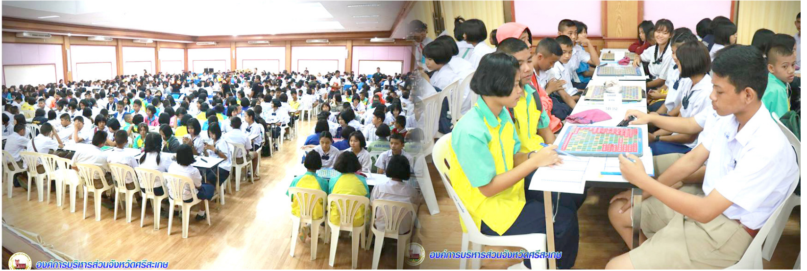
องค์การบริหารส่วนจังหวัดศรีสะเกษ