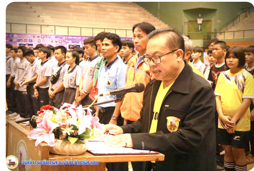
ภาพการบริการส่วนจังหวัดศรีสะเกษ