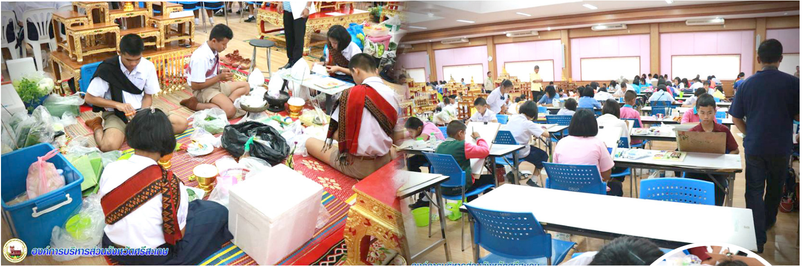
องค์การบริหารส่วนจังหวัดศรีสะเกษ