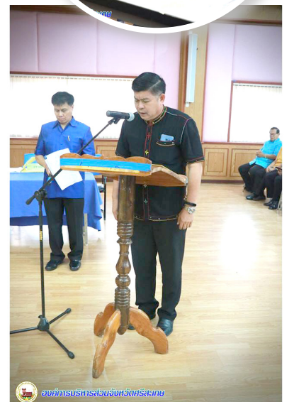
องค์การบริหารส่วนจังหวัดศรีสะเกษ