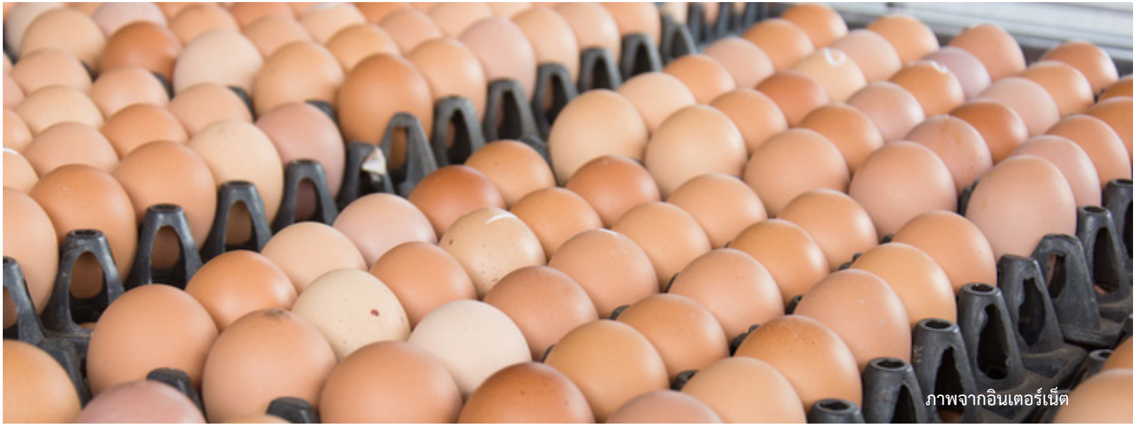
ภาพจากอินเทอร์เน็ต