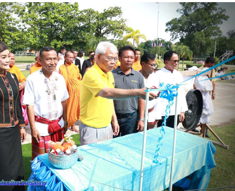
ส่วนจังหวัดศรีสะเกษ