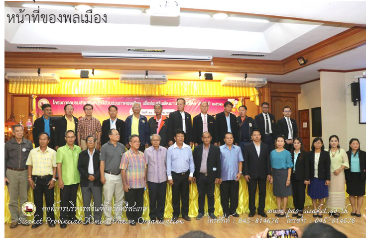
หน้าที่ของพลเมือง

ภาคพลเมือง สถาบันพระปกเกล้า จังหวัดศรีสะเกษ และภาคีเครือข่ายธรรมภิบาลภาคประชาชนคนศรีสะเกษ กำหนดจัดการอบรมส่งเสริมการมีส่วนร่วมภาคพลเมือง เพื่อส่งเสริมพัฒนาประชาธิปไตย ประจำปี 2562 จำนวน 2 รุ่นๆ ละ 250 คน โดยในวันนี้เป็นรุ่นที่ 1 ทั้งนี้เพื่อให้ความรู้ความเข้าใจที่ถูกต้อง เกี่ยวกับการปกครองระบอบประชาธิปไตย เพื่อส่งเสริมความเข้าใจในวิถีประชาธิปไตยและวัฒนธรรมอันดีงามทางการเมือง เพื่อส่งเสริมการมีส่วนร่วมทางการเมืองตามระบอบประชาธิปไตย อันมีพระมหากษัตริย์ทรงเป็นประมุข และเพื่อเสริมสร้างจิตสำนึกความเป็นพลเมือง สิทธิและ