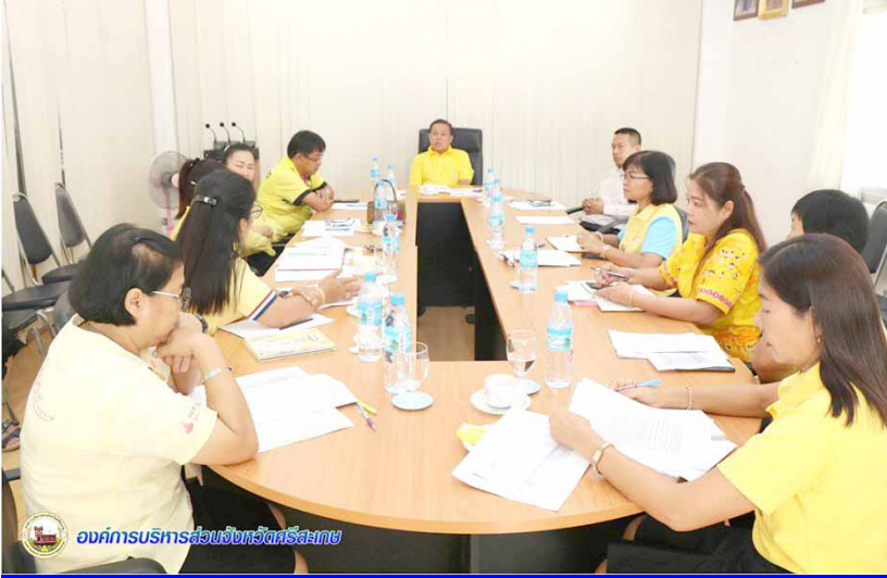
องค์การบริหารส่วนจังหวัดศรีสะเกษ