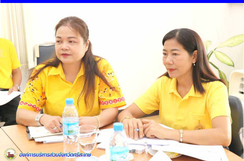
องค์การบริหารส่วนจังหวัดศรีสะเกษ