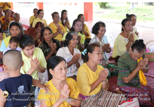
องค์การบริหารส่วนจังหวัดศรีสะเกษ Srisaket Provincial Administrative Organization โทรศัทพ์ : 045-814676 โทรสาร : 045-814676

โรงเรียนศีล ๕ ตามรอยพ่ออย่างพอเพียง ประกอบด้วยโรงเรียนในสังกัด สพบ.เขต 1-4 โรงเรียนในสังกัด สพม.28 และ ในสังกัด อบจ.ศรีสะเกษ