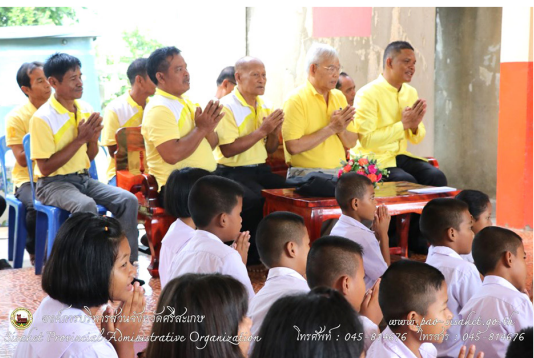
องค์การบริหารส่วนจังหวัดศรีสะเกษ Srisaket Provincial Administrative Organization โทรศัทพ์ : 045-814676 โทรสาร : 045-814676