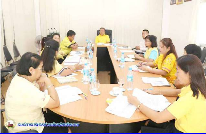
องค์การบริหารส่วนจังหวัดศรีสะเกษ