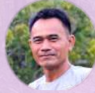
กวัง ทงทอม คิมกันตมาล