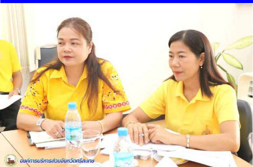
องค์การบริหารส่วนจังหวัดศรีสะเกษ