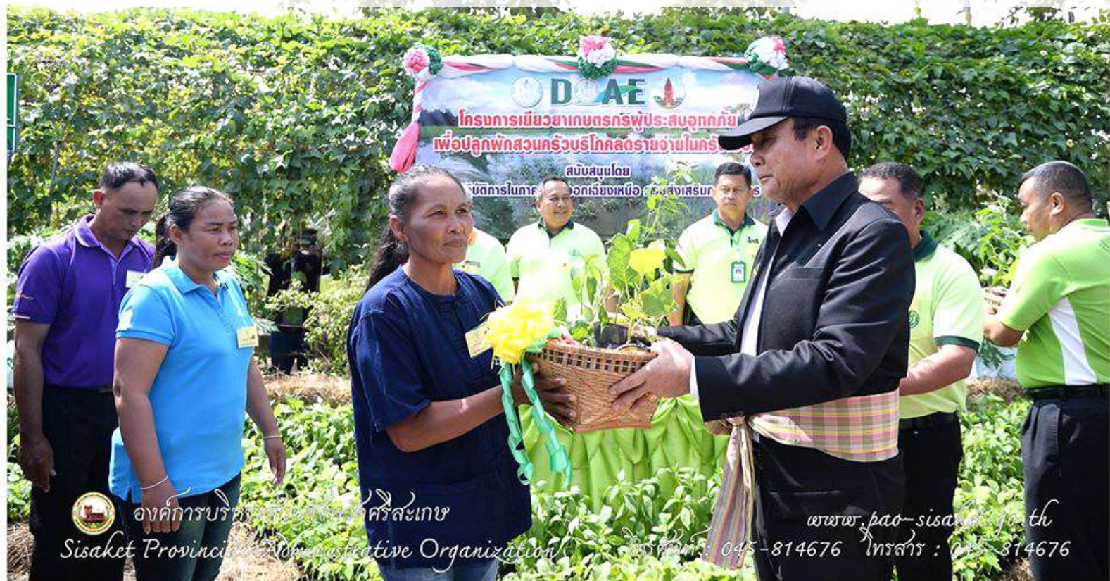
องค์การบริหารส่วนจังหวัดศรีสะเกษ Sisaket Provincial Administrative Organization www.pao-sisaket.go.th โทรสาร : 045-814676

เรียบเรียงจาก : ไอเอ็นเอ็นนิวส์ / สยามรัฐออนไลน์ / เว็บไซต์กระทรวงเกษตรและสหกรณ์