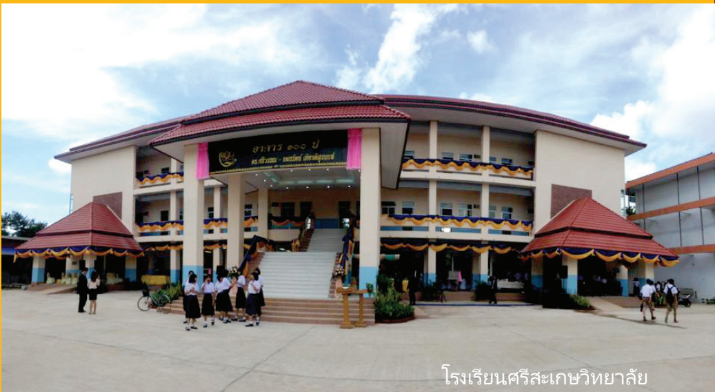
โรงเรียนศรีสะเกษวิทยาลัย