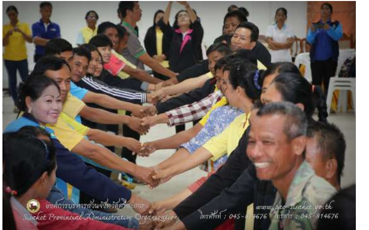
องค์การบริหารส่วนจังหวัดศรีสะเกษ Sisaket Provincial Administrative Organization www.pao-sisaket.go.th โทรศัพท์ : 045-814676 โทรสาร : 045-814676