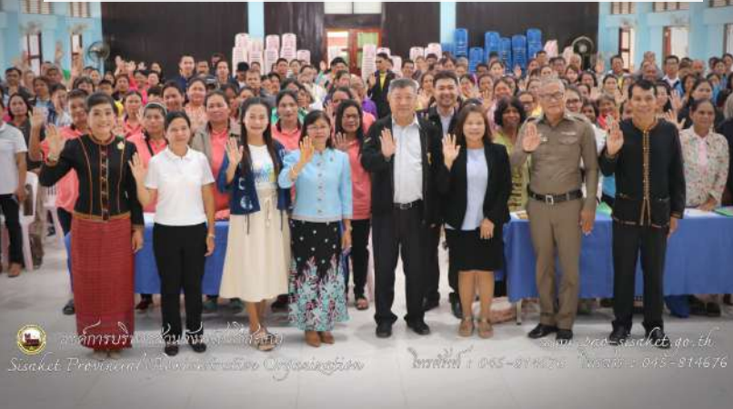
องค์การบริหารส่วนจังหวัดศรีสะเกษ Sisaket Provincial Administrative Organization www.pao-sisaket.go.th โทรศัพท์ : 045-814676 โทรสาร : 045-814676