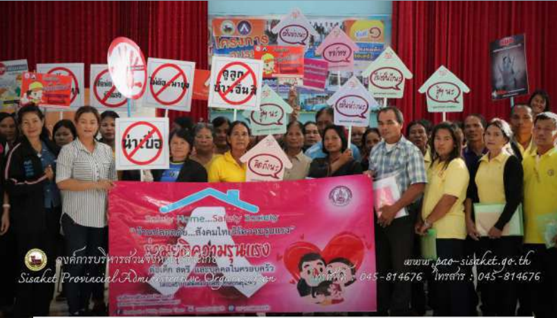
องค์การบริหารส่วนจังหวัดศรีสะเกษ Sisaket Provincial Administrative Organization www.pao-sisaket.go.th โทรศัพท์ : 045-814676 โทรสาร : 045-814676