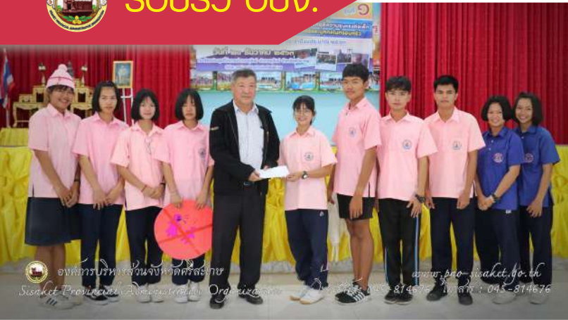
องค์การบริหารส่วนจังหวัดศรีสะเกษ Sisaket Provincial Administrative Organization www.pao-sisaket.go.th โทรศัพท์ : 045-814676 โทรสาร : 045-814676