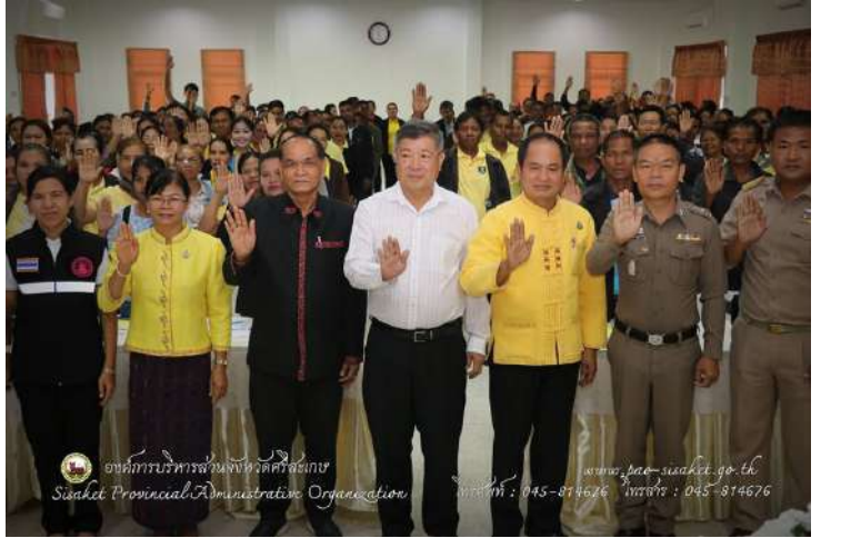
องค์การบริหารส่วนจังหวัดศรีสะเกษ Sisaket Provincial Administrative Organization www.pao-sisaket.go.th โทรศัพท์ : 045-814676 โทรสาร : 045-814676